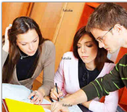
Abb. 1: In Gruppen- oder Partnerarbeit unterstützen sich die Schüler gegenseitig und lernen kooperativ.

Stärker individualisierter Unterricht initiiert bei den Schülern mehr erfolgreiche Lernprozesse, provoziert weniger Versagenerfahrungen und beeinflusst so die Lernbiografie der Schüler positiv.